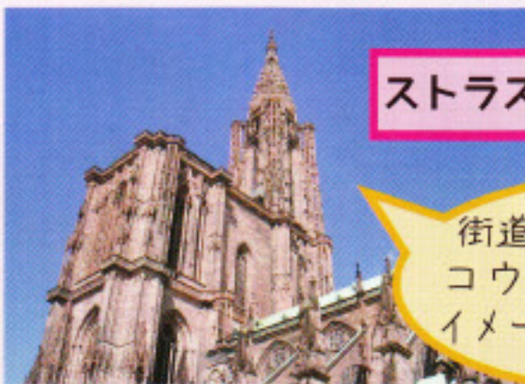
ストラスブール大聖堂